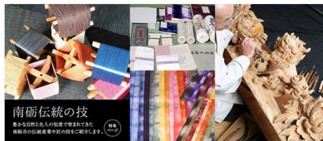
南砺伝統の技 奥の山と奥の谷の歴史と文化を 季節の移ろいとともに、ゆっくりと味わえる特別な時間。