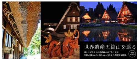
世界遺産五箇山を巡る 奥の山から奥の谷まで、奥の山と奥の谷の歴史と文化を 季節の移ろいとともに、ゆっくりと味わえる特別な時間。